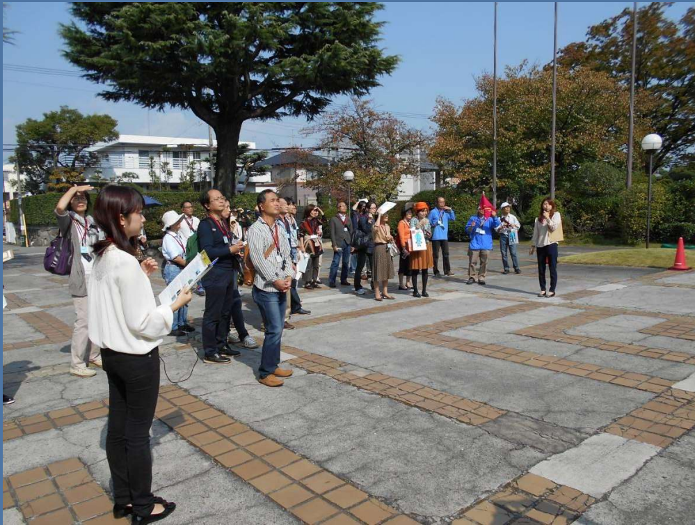
建造物案内(まちたび博・甲子園会館)