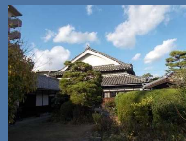
森松家住宅 江戸～大正