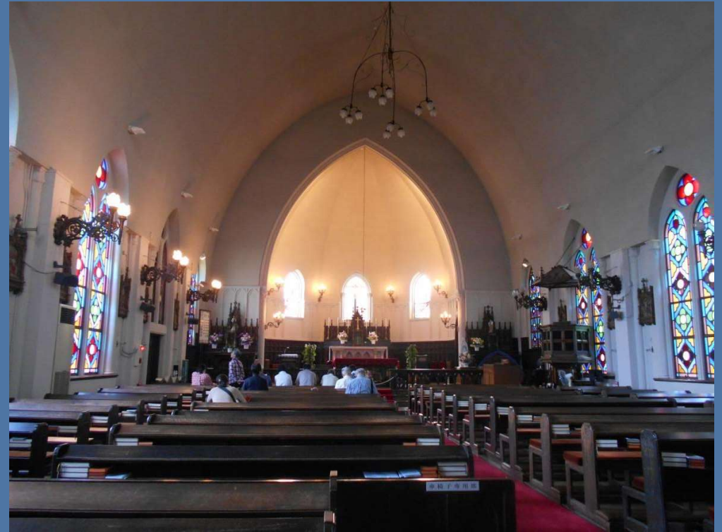
建造物案内(公民館活動・夙川カトリック教会)