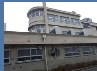
尼崎市役所開明庁舎 昭和12年設立