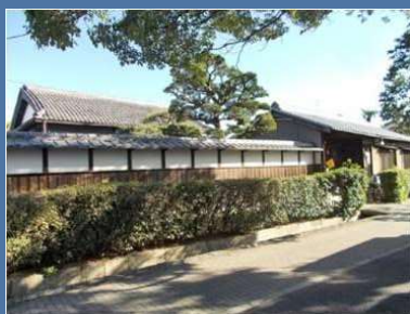
田近家住宅 江戸後半～大正