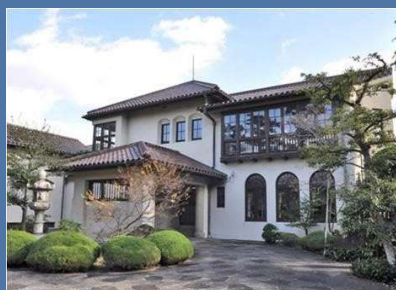
松山大学温山記念会館 昭和3年設立