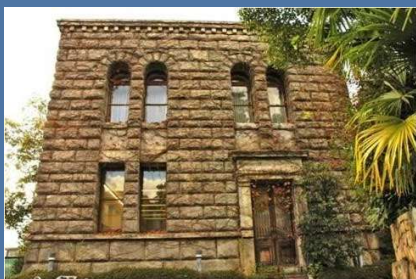
旧松山家住宅松濤館 昭和5年移築

事例：阪神南地区の国登録有形文化財建造物(18戸) 尼崎市：10戸 西宮市：6戸 芦屋市：2戸