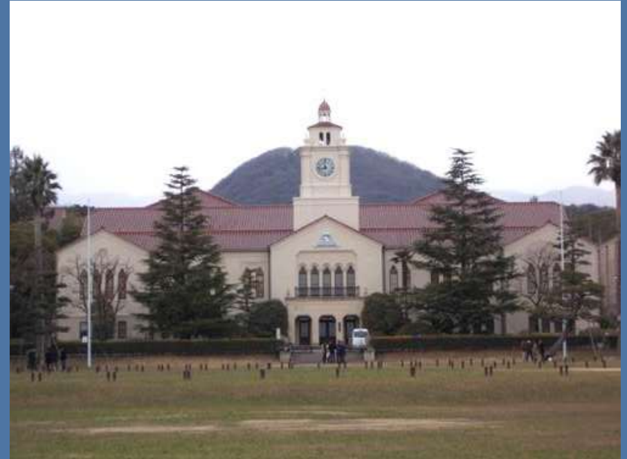
関西学院大学時計台(旧図書館)