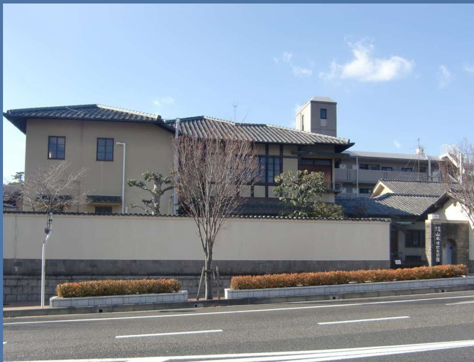
旧山本家住宅(山本清記念財団会館)