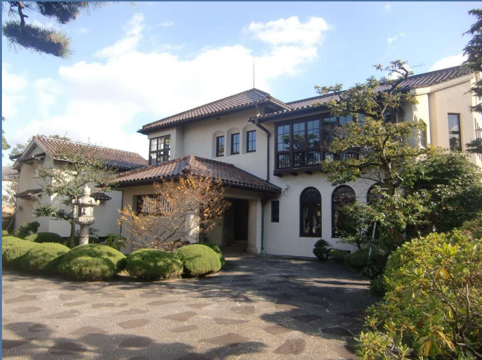
松山大学温山記念会館(旧新田家住宅)