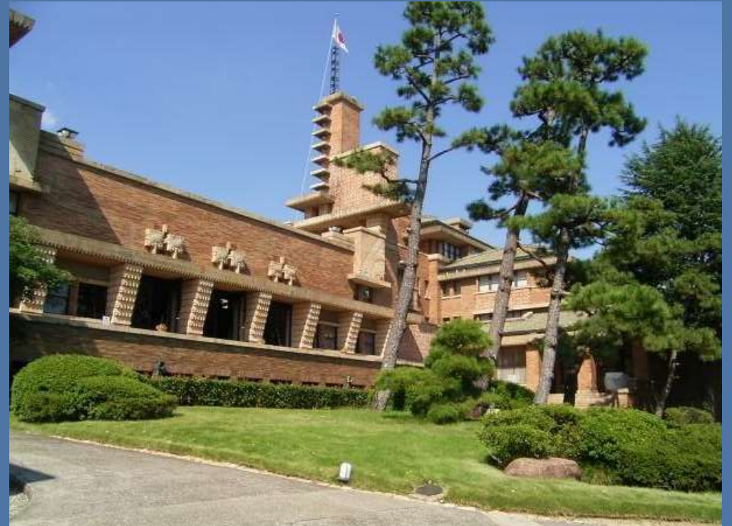
武庫川女子大学甲子園会館(旧甲子園ホテル)